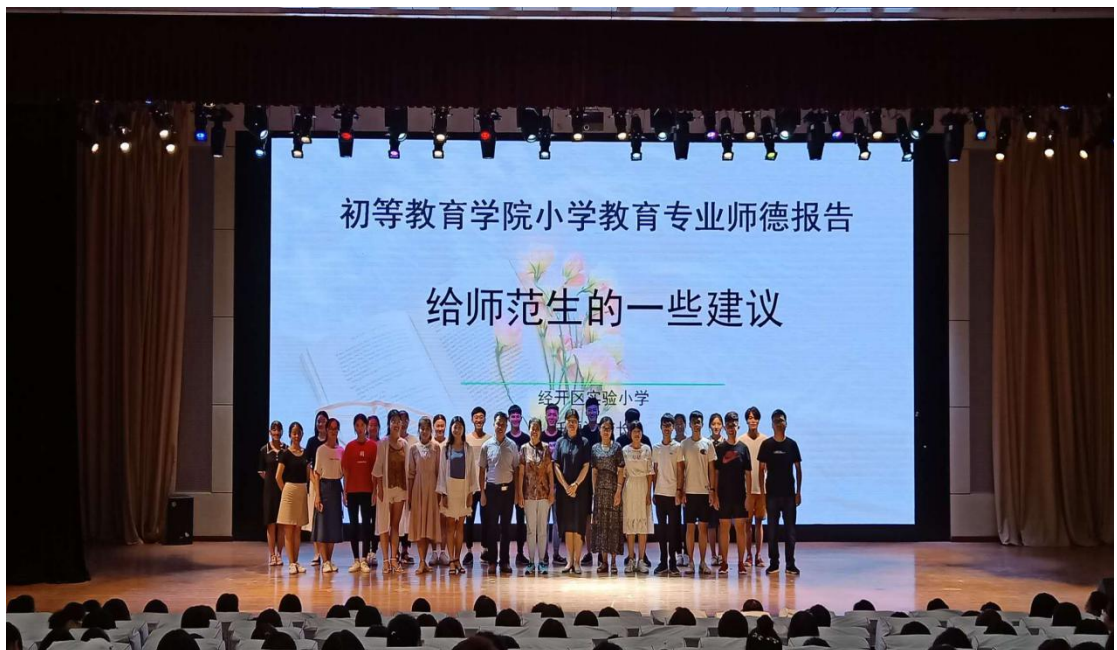
郑州师范学院初等教育学院记者团

通过本次报告，同学们从任校长身上学到了如何做一名真正优秀的小学教师，不仅要从师德、专业、心态入手还要认真做好生活中的每一件事。报告会在全场掌声中圆满结束。