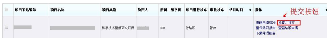
(结项材料上传示意图)