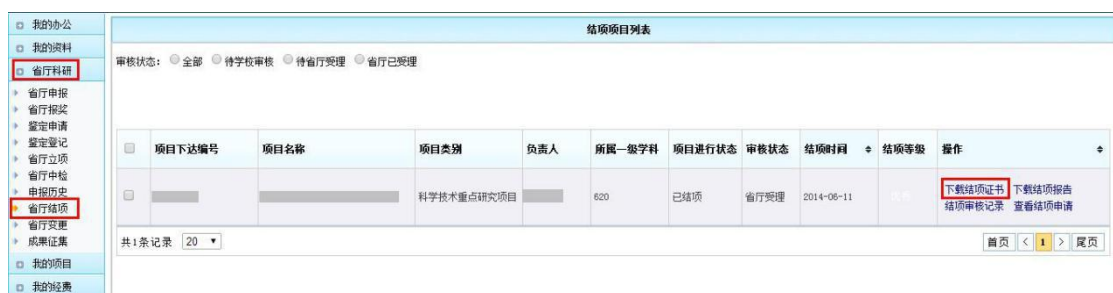
(结项证书下载示意图)

第四步： 项目负责人确认状态为【已结项】且结项时间和结项等级已填充，此时省厅审核通过，项目负责人可以登录系统，如下图路径，点击【省厅结项】，在列表中蓝色按钮区下载结项证书。