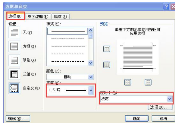
图 2-2 页眉线设置方法